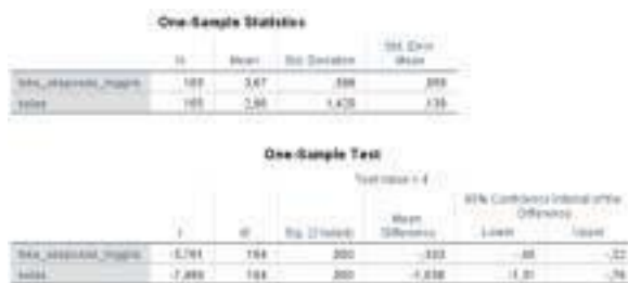
Gambar 3 Hasil Uji t Satu Sampel Data Kemampuan Membaca Teks Eksposisi versi Bahasa Inggris

membaca teks eksposisi versi bahasa Inggris bagi siswa kelas X SMA Negeri 1 Bungaraya, Kabupaten Siak, Provinsi Riau berkategori rendah; skor mean maksimal yang bakal diraih hanya 4 dari 7 skor total' ditolak. Maknanya, skor kemampuan membaca teks eksposisi versi bahasa Inggris memang rendah; di bawah nilai perkiraan.