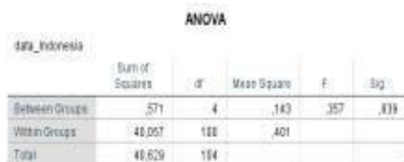
Gambar 4 Hasil Uji ANOVA Searah Data Kemampuan Membaca Teks Eksposisi versi Bahasa Indonesia per Kelompok Sampel

Kemampuan membaca teks eksposisi versi bahasa Indonesia dianalisis juga per kelompok sampel. Analisis menggunakan prosedur statistik uji ANOVA searah. Nilai F sebesar 0,357 pada sig. 0,859. Nilai ini besar dari nilai alpha 0,05 (Gambar 4). Dengan demikian, kemampuan membaca teks eksposisi versi bahasa Indonesia tidak berbeda menurut perbedaan kelompok sampel. Oleh karena itu, hipotesis penelitian 'tidak terdapat perbedaan kemampuan membaca teks eksposisi versi bahasa Indonesia menurut kelompok sampel siswa kelas X SMA Negeri 1 Bungaraya, Kabupaten Siak, Provinsi Riau' diterima.