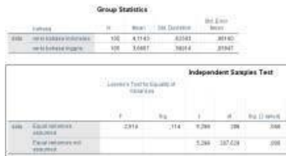
Gambar 3 Hasil Uji t Sampel Independen Data Kemampuan Membaca Teks Eksposisi menurut Perbedaan Bahasa

Prosedur statistik uji t sampel independen digunakan untuk menganalisis perbandingan data antara kemampuan membaca teks eksposisi versi bahasa Indonesia dan kemampuan membaca teks eksposisi versi bahasa Inggris. Perbandingan versi bahasa yang dimaksudkan di sini adalah komparasi skor rata-rata (mean) kemampuan membaca teks eksposisi versi bahasa Indonesia dengan versi bahasa Inggris itu sendiri. Hasil uji t sampel independen sebesar 5,298 dengan nilai sig. 0,000 (Gambar 3). Dengan demikian, sig. 0,000 < p = 0,05. Kondisi nilai ini adalah untuk kriteria penolakan Ho. Oleh karena itu, hipotesis penelitian 'tidak terdapat perbedaan kemampuan membaca teks eksposisi versi bahasa Indonesia dan versi bahasa Inggris bagi siswa kelas X SMA Negeri 1 Bungaraya, Kabupaten Siak, Provinsi Riau, ditolak. Dengan kata lain, perbedaan versi bahasa memperlihatkan perbedaan kemampuan membaca teks eksposisi.