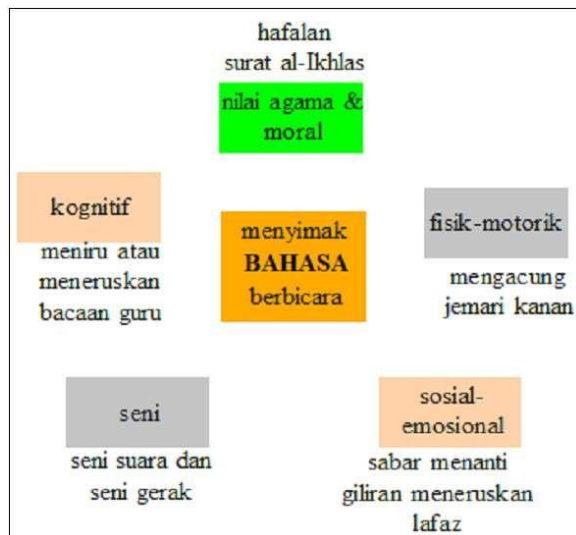
Gambar-2 Kedudukan Aspek Fokus terhadap Aspek Integrasi Topik Islam

Ikhlas. Kelima , aspek seni yakni mengembangkan nilai keindahan suara, keindahan menggerakkan anggota tubuh yakni jemari tangan kanan saat sedang diacungkan (Gambar 2).