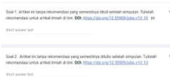
Gambar-2 Tangkapan Layar Halaman Soal Esai di Google Form

Tes berisi nomor soal yang bersumber dari artikel yang berbeda. Tes ini memenuhi syarat validitas yang memanfaatkan google form. Dengan kata lain, google form menjadi media penelitian ini di samping media artikel ilmiah jurnal online (Gambar-2).