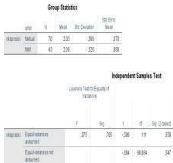
Gambar 4 Hasil Tangkapan Layar Penghitungan Uji t Sampel Independen Data Keterampilan Menemukan Isi Teks Eksposisi per Pengetahuan Siswa tentang Sifat Teks Eksposisi

Nilai uji t sampel independen adalah -0,588. Nilai ini berada pada nilai sig. 0,588. Dengan demikian, sig. 0,588 > p = 0,05. Oleh karena itu, Ho diterima. Maknanya, mean 2,03 yang dimiliki oleh siswa yang menilai bahwa teks eksposisi bersifat faktual (jawaban benar) dinyatakan tidak berbeda dengan mean 2,09 yang dimiliki oleh siswa yang menilai bahwa teks eksposisi bersifat fiktif; merupakan jawaban tidak benar (Gambar 4).