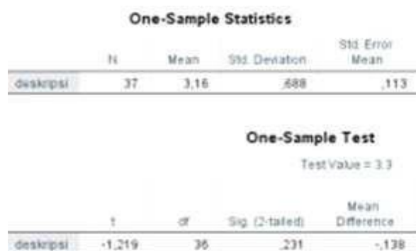
Gambar 1 Tangkapan Layar Hasil Penghitungan Uji t Satu Sampel Data Keterampilan Menemukan Kalimat dan Gagasan Teks Deskripsi Siswa SMP Negeri 15 Dumai dan Siswa SMP Negeri 21 Dumai.

siswa SMP Negeri 15 Dumai dan SMP Negeri 21 Dumai menghasilkan nilai t hitung sebesar -1,219. Nilai ini berada pada sig. 0,231 dengan df 36 sehingga sig. 0,231 > p = 0,05 (Gambar 1). Kriteria ini adalah kriteria penerimaan Ho. Artinya, rata-rata keterampilan menemukan kalimat dan gagasan teks deskripsi siswa SMP Negeri 15 Dumai dan siswa SMP Negeri 21 Dumai sebesar 3,16 sama dengan rata-rata dugaan 3,3 sebagai nilai pembandingan dalam uji t satu sampel. Rata-rata 3,16 dan rata-rata pembandingan 3,30 sama-sama termasuk dalam kategori rendah. Tafsirannya, keterampilan menemukan kalimat dan gagasan teks deskripsi siswa SMP Negeri 15 Dumai dan siswa SMP Negeri 21 Dumai berkategori rendah.